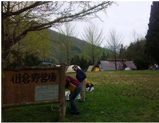
↑ キャンプ場入り口

設備は炊事場とトイレ、ファイヤーサークルがあり、キャンプファイヤも楽しめます。近くには「ゆ〜楽」「くろば温泉」「五箇山荘」などの温泉施設もあります。森林浴を楽しみながら少し歩けば世界遺産相倉合掌造り集落にも行けるので、集落内を散策するのもおすすめです。