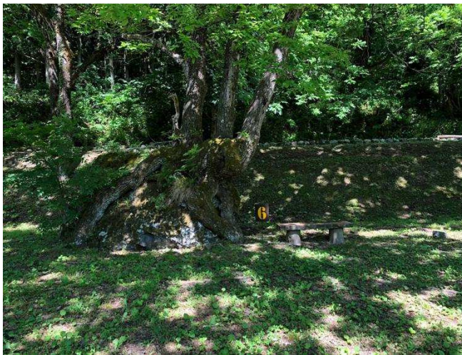
↑ 木陰が心地良いです (*^_^*)