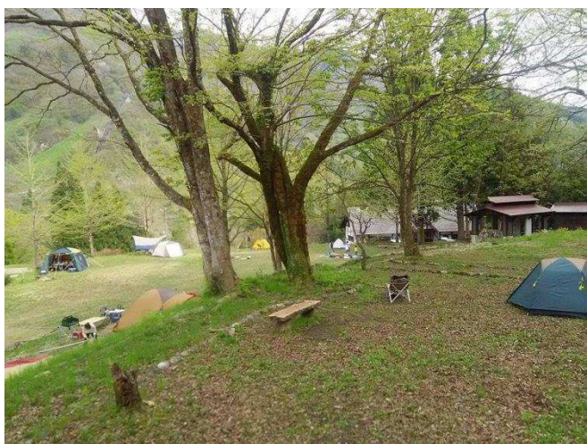
↑ 二段目サイト、三段目サイト