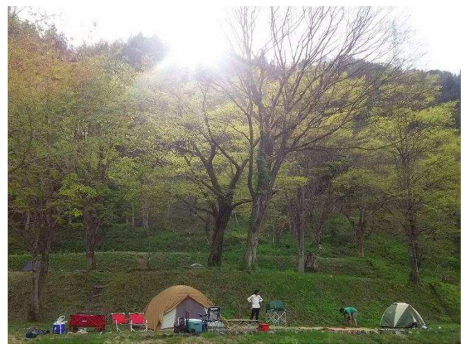
↑ 1組用サイトにはテント2張りまでOKです