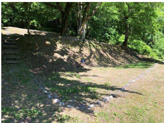
↑ お1人用サイトは2箇所