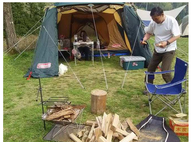
↑ 思い思いの時間をお過ごし下さい。